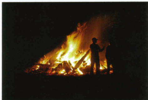
Ein Spiel aus Licht und Schatten: das Osterfeuer in Obercastrop

stadt Castrop-Rauxel, wo er auf der Suche nach stimmungsvollen Szenarien schnell fündig wurde. »Geknipst« wurde vornehmlich zur »blauen Stunde«, jener kurzen Zeitspanne direkt nach Sonnenuntergang, in der durch das Restlicht des Tages ein besonders tiefes Blau vorherrscht. Die so entstandenen Fotografien von lokalen Highlights wie dem Stadtgarten oder dem Erin-Förderturm waren Mitte letzten Jahres als großformatige Bilder für zwei Monate im Schaufenster des Friseursalons Räth zu sehen. Bei dem in Kooperation mit dem Künstlerbund Herne/Castrop-Rauxel veranstalteten Projekt dürfen nur Künstler ausstellen, die mit der Kunst nicht ihren Lebensunterhalt verdienen.