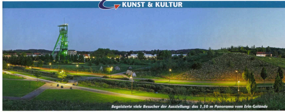
Begeisterte viele Besucher der Ausstellung: das 1,50 m Panorama vom Erin-Gelände