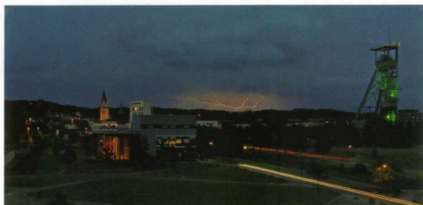
Gewitter über Erin

Gerne verbringt der Mensch seinen Urlaub am Meer. Dort lauscht er dem Rauschen der Wellen und dem Kreischen der Möwen, er schmeckt die salzige Luft und spürt den kühlen Wind auf seiner Haut. Vielleicht spaziert er barfuß den Strand entlang und lässt seinen Blick über das tiefblaue Wasser schweifen. Am Horizont glitzern winzige Schaumkronen in der Abendsonne. Ein atemberaubendes Panorama!